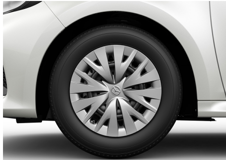
15-ZOLL-STAHLFELGEN MIT 185/65 R15 BEREIFUNG